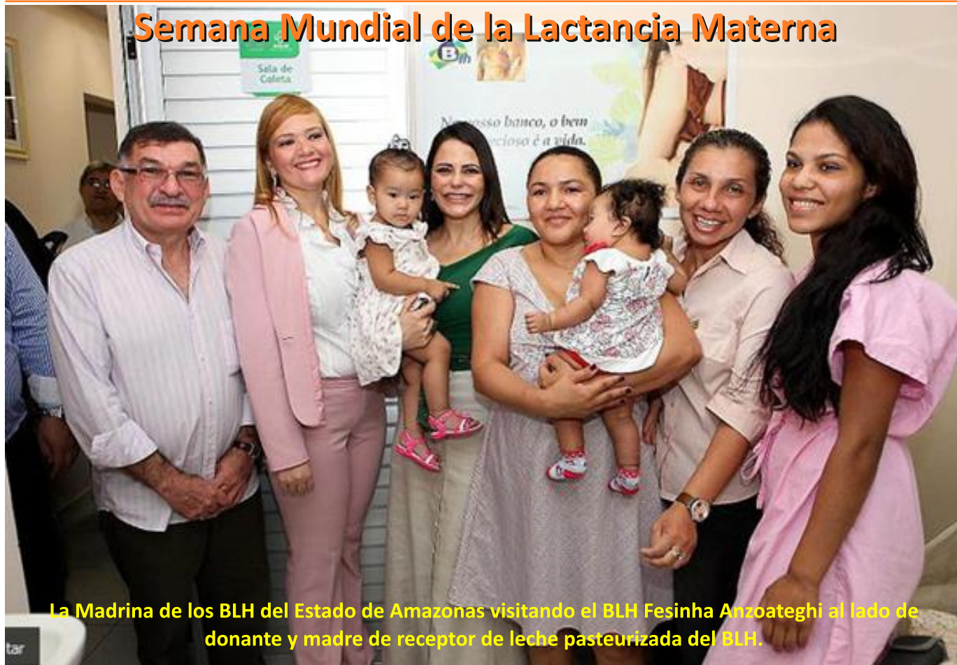
La Madrina de los BLH del Estado de Amazonas visitando el BLH Fesinha Anzoategui al lado de donante y madre de receptor de leche pasteurizada del BLH.

La campaña incluye la distribución de material gráfico (pósters, folletos y banners) en las unidades de salud, empresas, escuelas y asociaciones comunitarias. Además de destacar la importancia de la leche materna, el material orienta a las donantes sobre la forma correcta de extraer la leche a ser donada.