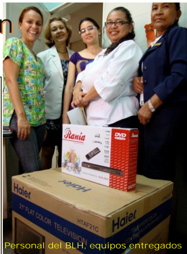
Personal del BLH, equipos entregados