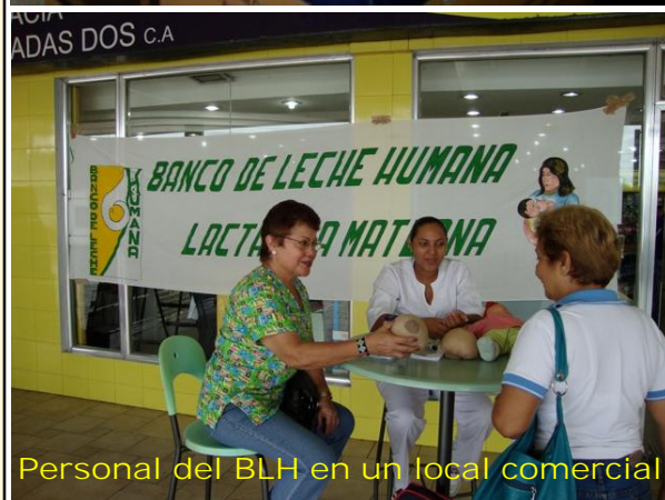
Personal del BLH en un local comercial