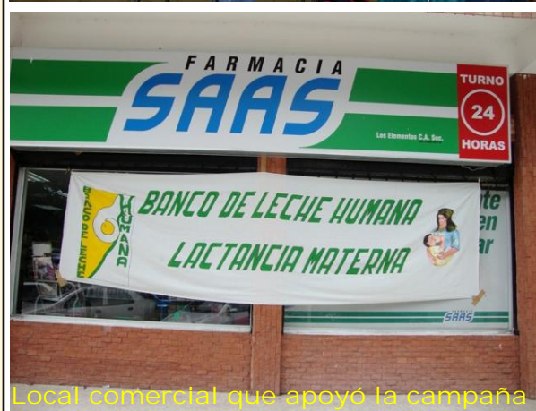
Local comercial que apoyó la campaña