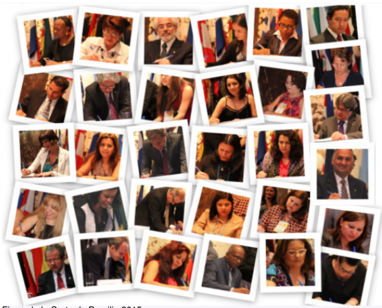
Firma de la Carta de Brasilia 2015